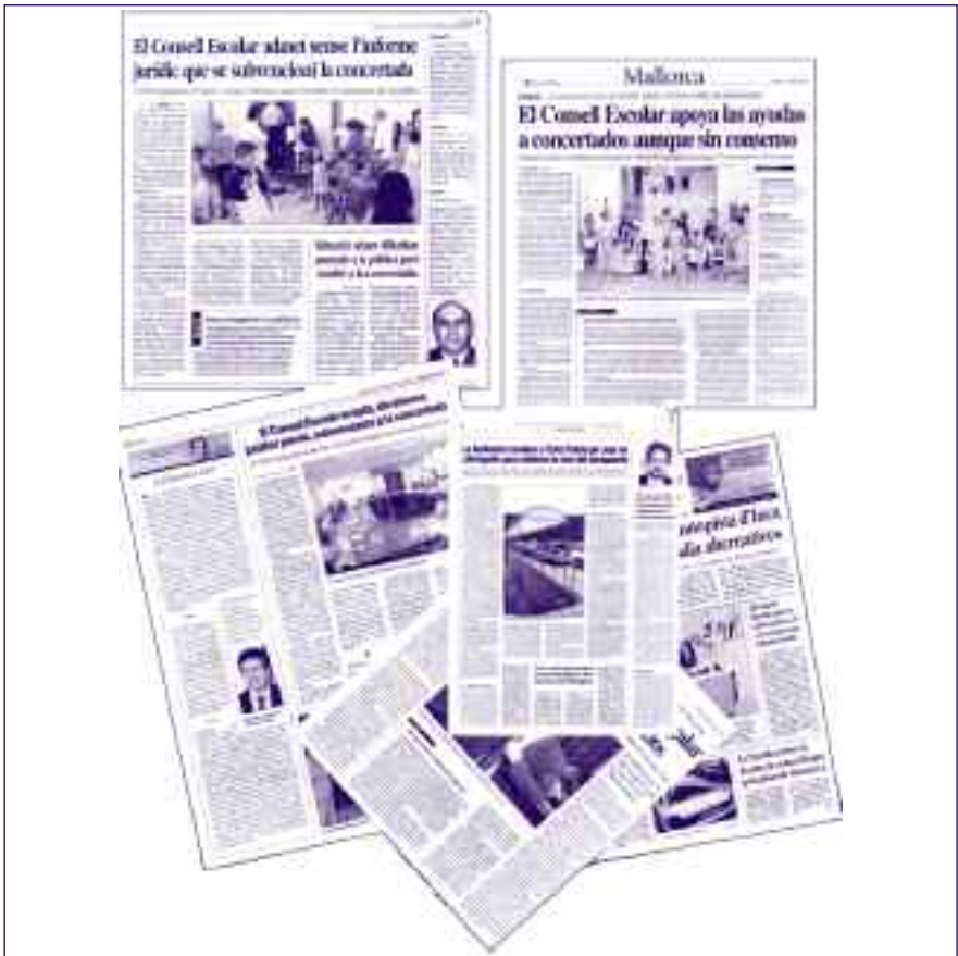
La premsa de Palma es va fer ressò d'aquest Ple.