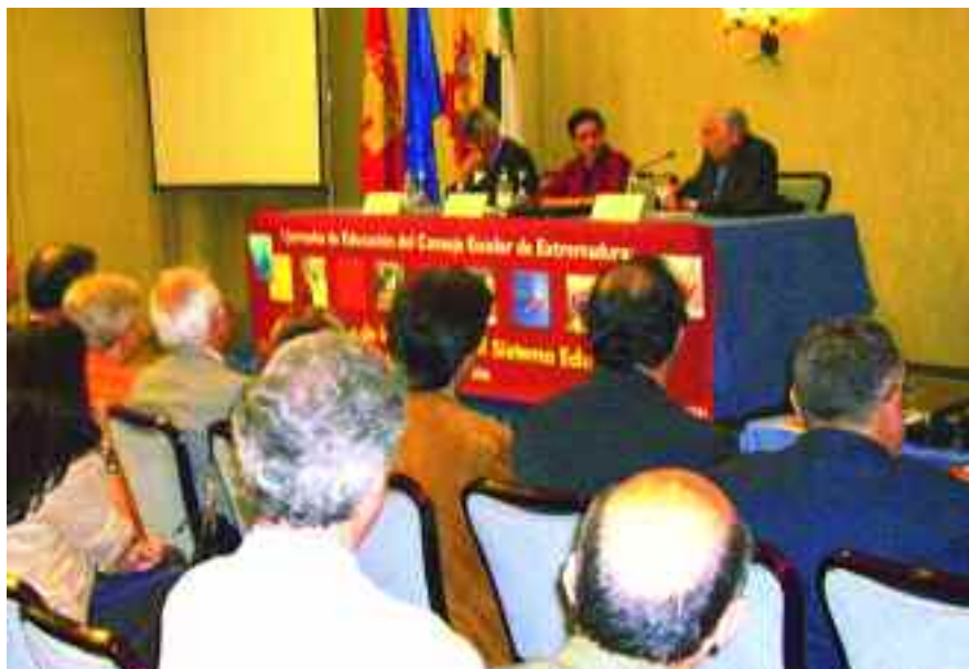
El President del Consell Escolar d'Extremadura presenta les Jornades.