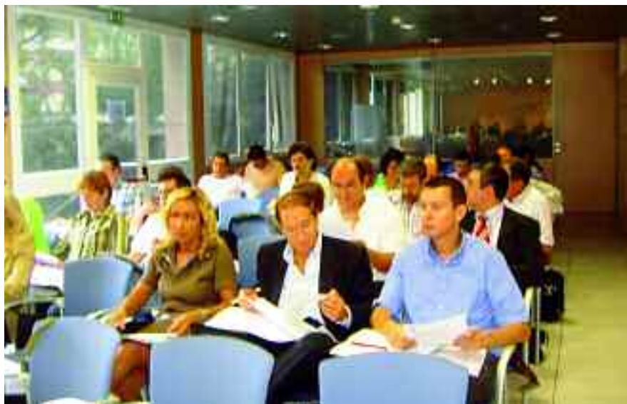
Asistents al Ple celebrat al saló d'actes de la FELIP el 6 d'octubre de 2006.