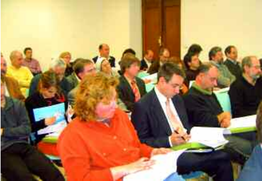
Assistents a aquest Ple, celebrat a l'Escola Superior de Disseny de Palma.