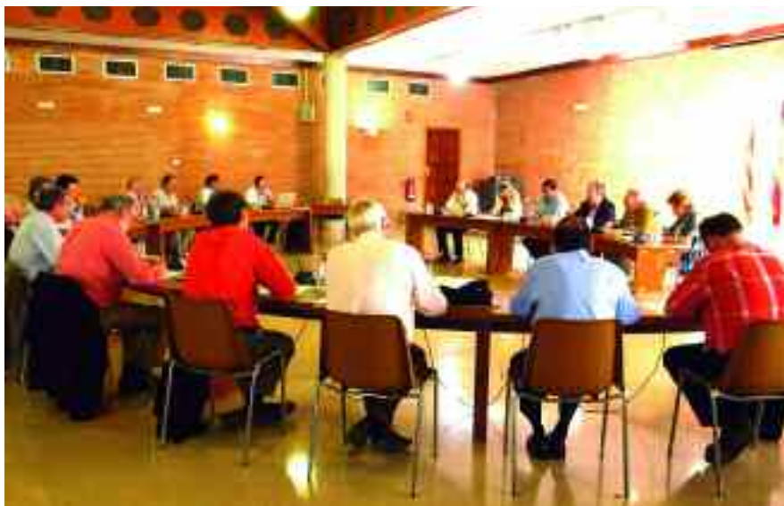
Una instantània de la reunió celebrada a la Conselleria d'Educació de València.