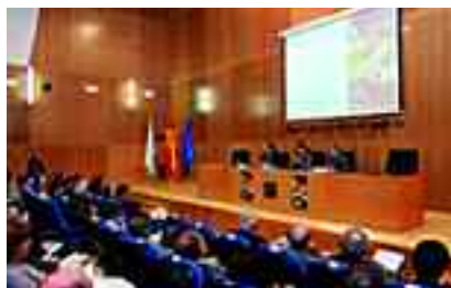
Consellera d'Educació a Galícia i Vicepresidenta del Consell Escolar en la inauguració de les Jornades.