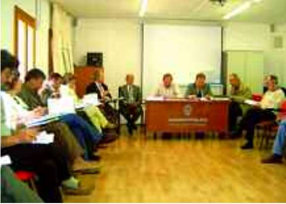
Taula presidencial del Ple celebrat al saló del Centre Cultural Guillem Cifre de Colonya de Pollença.