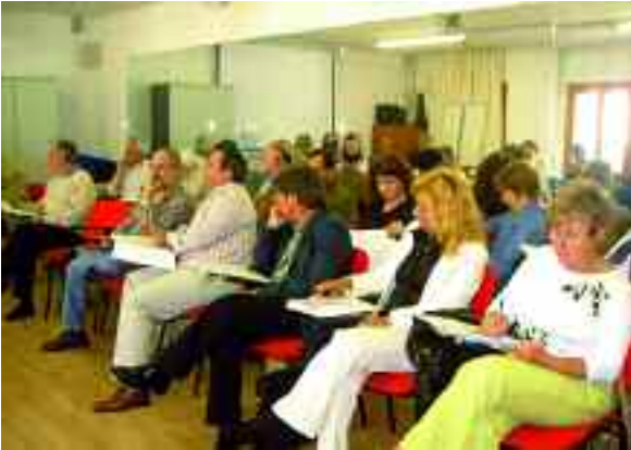
Assistents al Ple celebrat a Pollença.

S'aproven els Informes 03/2006 per 36 vots a favor, 0 en contra i 4 en blanc i els informes 04/2006 i 05/2006 per una unanimitat dels 36 consellers assistents.