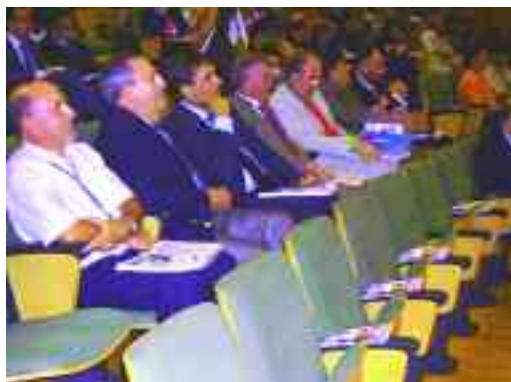
Presidents de Consells Escolars al Congrés sobre Convivència.