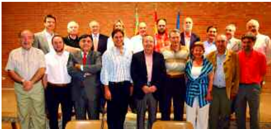
Els presidents i personal de secretaria de València i Balears reunits per preparar el XVII Encontre de Consell Escolars.