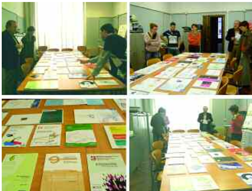
El jurat tingué dificultat de triar el logotip i cartell guanyador per quantitat i la qualitat dels treballs presentats.