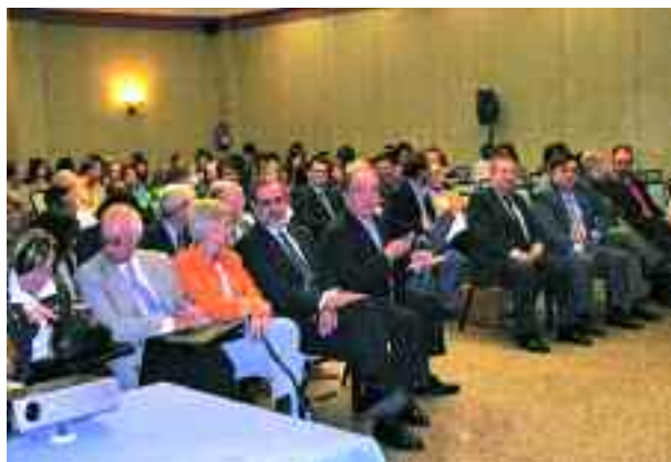
Presidents de Consells Escolars Autònoms ocupen la primera filera d'assistents.