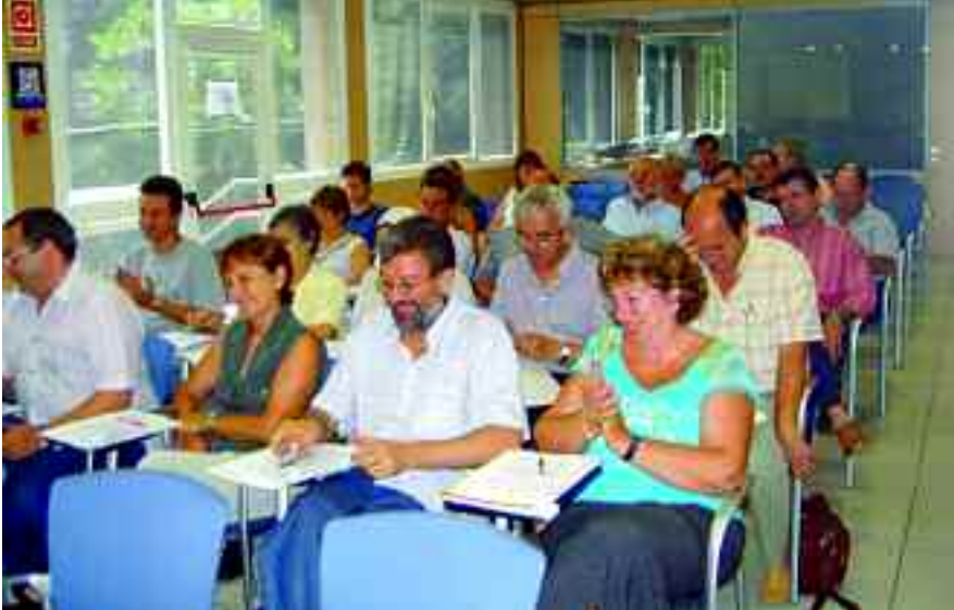
Un aspecte dels assistents a aquest Ple.