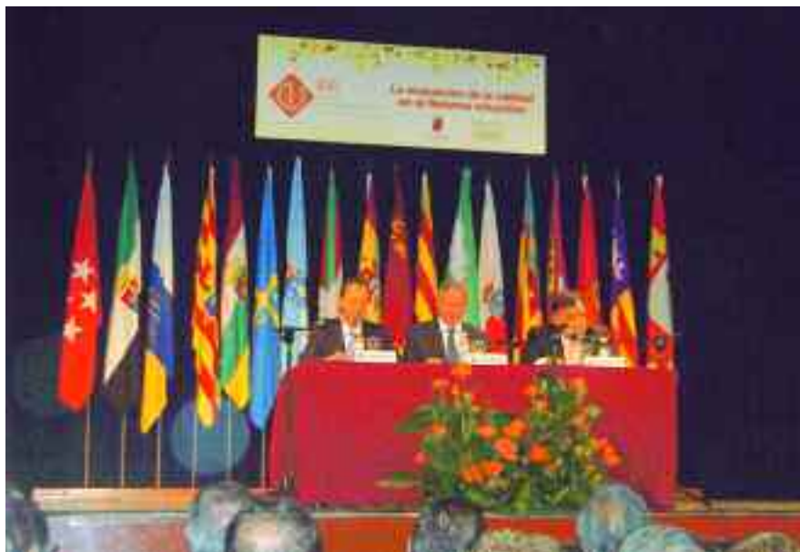
Les autoritats autonòmiques inauguren el XVI Encontre de Consells Escolars Autònoms i de l'Estat.