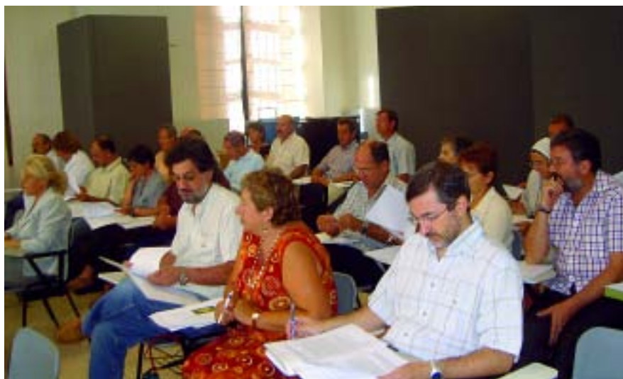
Assistents al Ple, en primer terme representants de l'STEI i de la UIB.