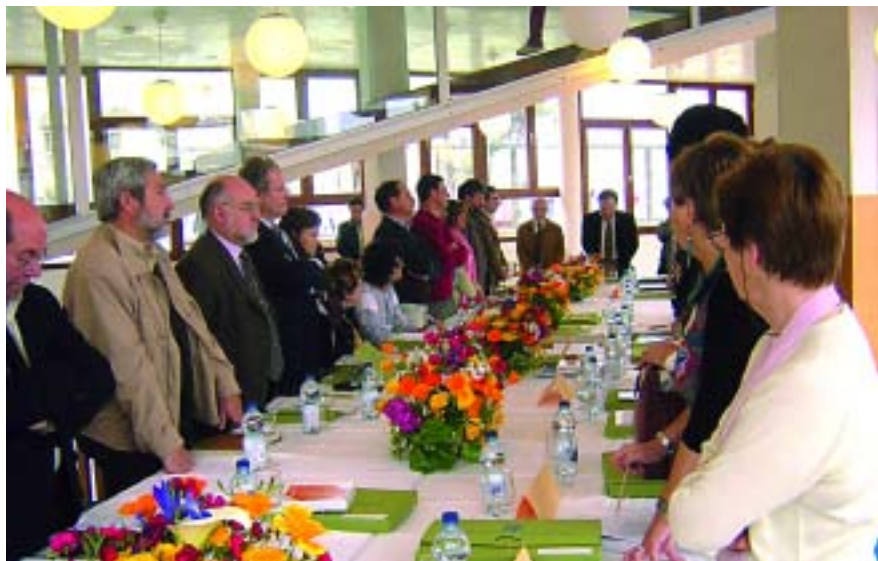
Els consellers i les conselleres guardaren un minut de silenci per la mort del Papa.