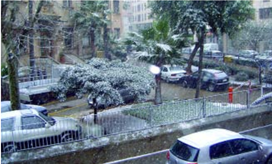
Perspectiva de la Conselleria de Sanitat, des de l'oficina del CEIB.