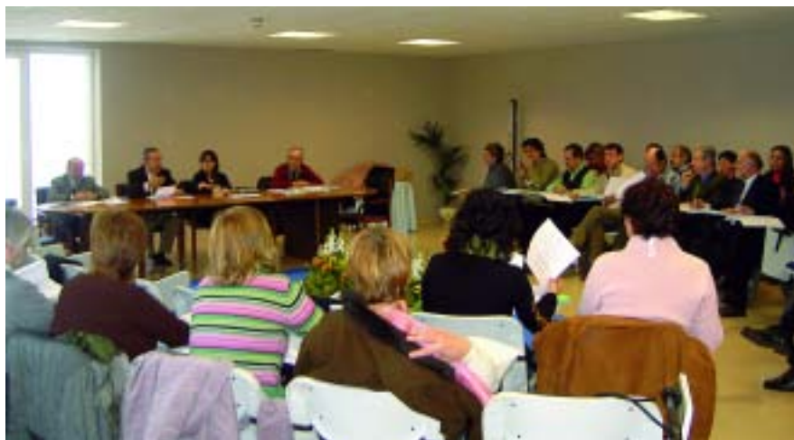
Inici del Ple a Eivissa.