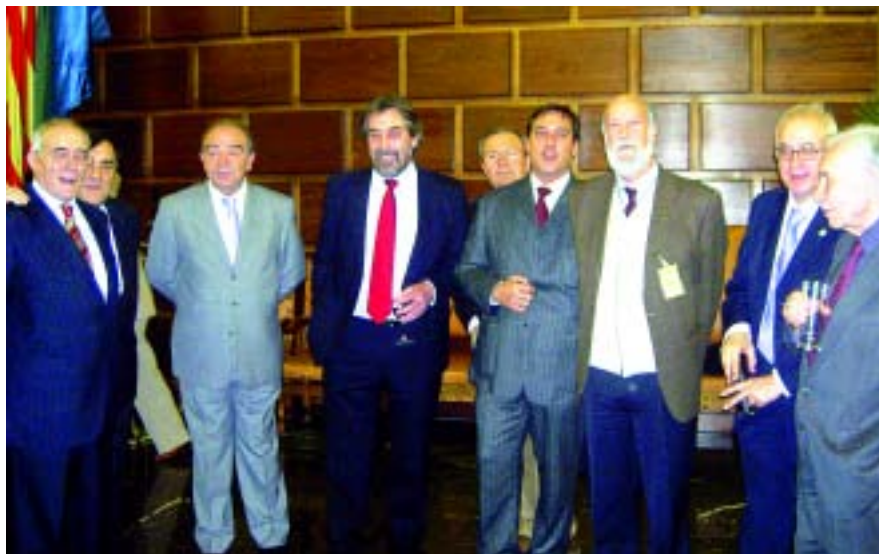
Presidents de diferents consells escolars varen ser rebuts pel batle de Saragossa.