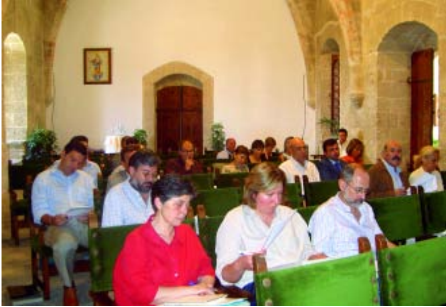
En primer terme els consellers i les conselleres representants de COAPA-Balears.