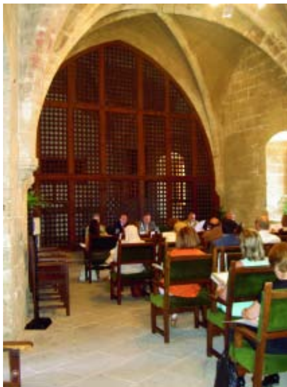
El marc incomparable del Castell de Bellver va servir per a un Ple històric del CEIB.