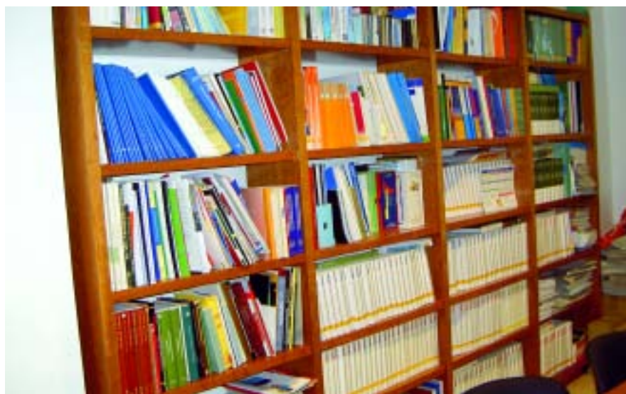
Biblioteca de la seu del CEIB.

Per gentilesa de la Direcció General de Cultura de la Conselleria d'Educació i Cultura, s'han rebut 50 llibres que, convenientment inventariats, passen a formar part de la Biblioteca del Consell Escolar.