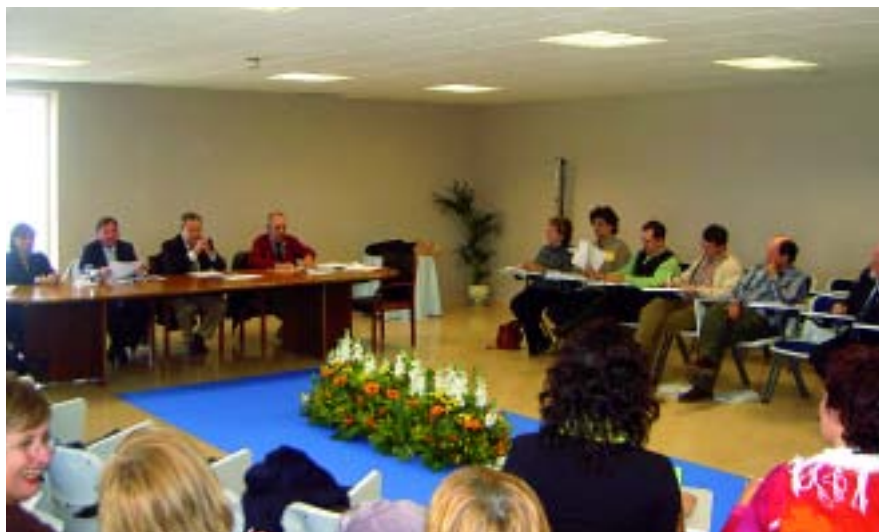
El conseller Sr. Fiol durant la seva intervenció.