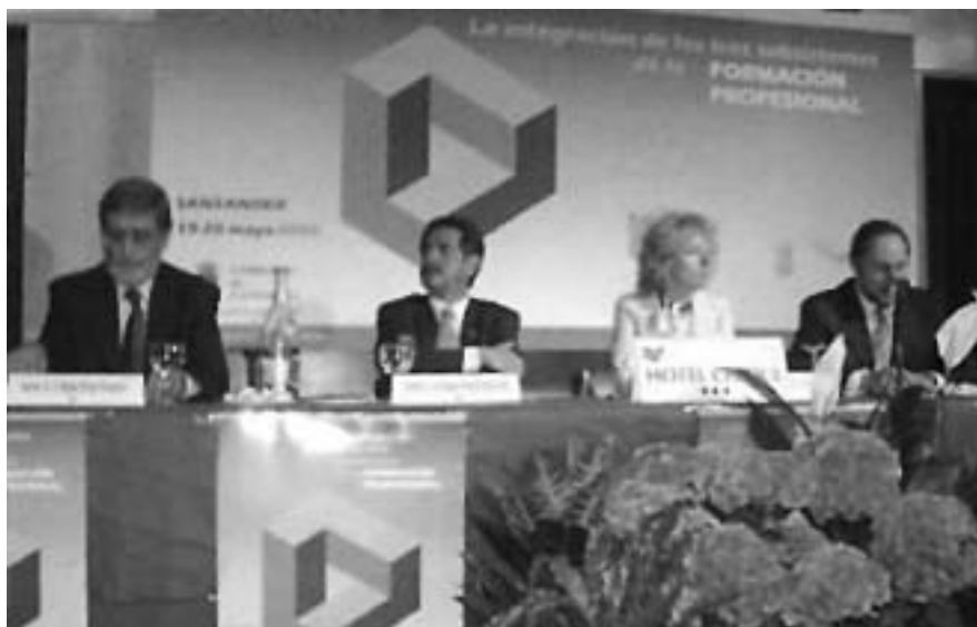
Mesa de presidència el dia de la inauguració de les Jornades de Formació a Cantàbria.