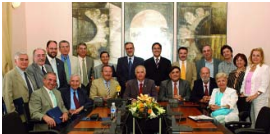
Presideix la reunió el president de Canàries, acompanyat dels de Múrcia i Balears, futurs organitzadors dels pròxims Encontres.