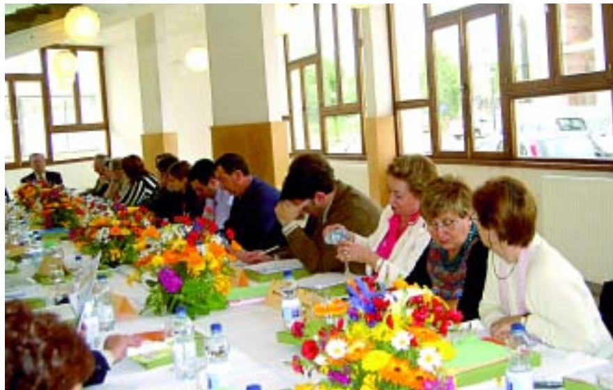
Dos aspectes de la sessió de feina del Ple celebrat al CP Blai Bonet de Santanyi.

El tema més problemàtic sorgit fou l'endarreriment en el pagament de despeses que es produeix des del mes de Febrer de 2004.