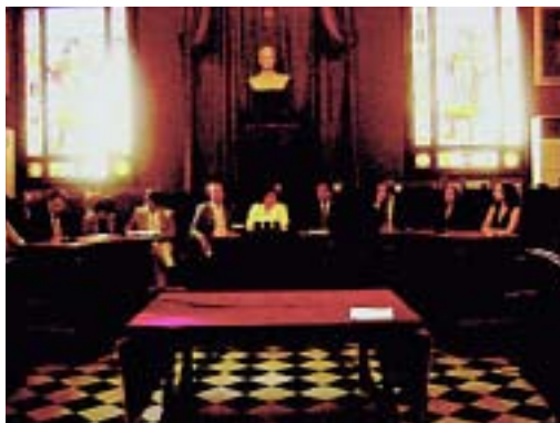
En el saló d'actes de l'Ajuntament es constituí el Consell Escolar de la ciutat de Palma.