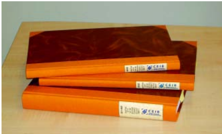
Actes enquadernades del Consell Escolar de les Illes Balears.

S'ha procedit a enquadernar les actes de les reunions de Ple, Permanent i Comissions, des de la creació del Consell Escolar de les Illes Balears, que queden enregistrades en 3 toms corresponents a: 2001-2002, 2003 i 2004.