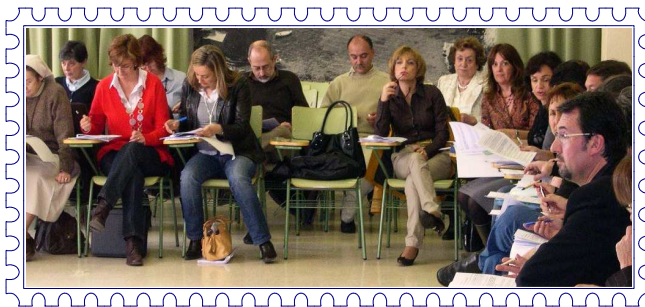
Consellers i conselleres del CEIB

A continuació el president va fer referència a la Trobada de Consells Escolars Autònoms i de l'Estat que es realitzarà el mes de maig a Bilbao i que tractarà sobre "Competències educatives bàsiques". Així mateix, informà sobre els propers projectes de decret que es tramitaran perquè siguin informats pel Consell Escolar, i a les 13:28 hores el president donà per conclosa la sessió plenària.