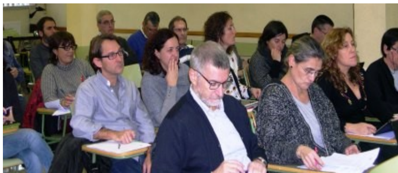
Consellers i conselleres del CEIB a la sala d'actes de l'IES Juníper Serra on es duagué a terme el Ple