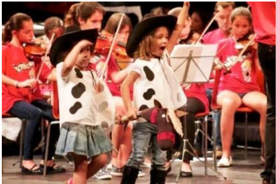
Concert d'alumnes del CEIP Son Serra. 24-11-2015

Afegeix que actualment és l'únic centre integrat públic de les Balears i un dels pioners de l'Estat que ofereix la possibilitat d'escolarització amb l'opció de cursar de manera simultània els ensenyaments elementals de règim especial de música amb les de règim general d'Educació Infantil i Primària.