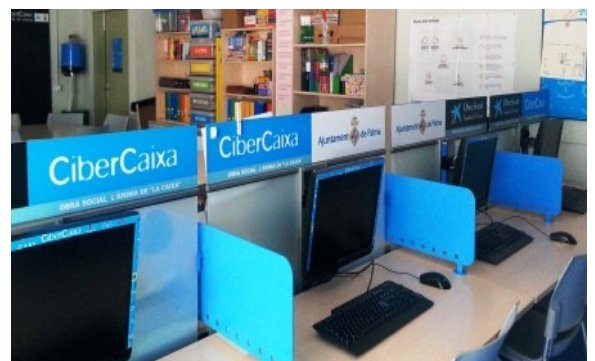
Ciberaula del centre, espai multifuncional del CEIP Joan Miró, obert per a les persones del barri