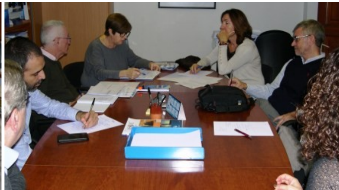
Comissió Permanent de dia 09-12-15