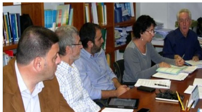
Comissió Permanent duta a terme dia 12-11-15 (seu del CEIB)