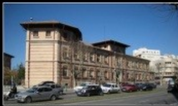
Diferents edificis que va ocupar l'Escola Normal