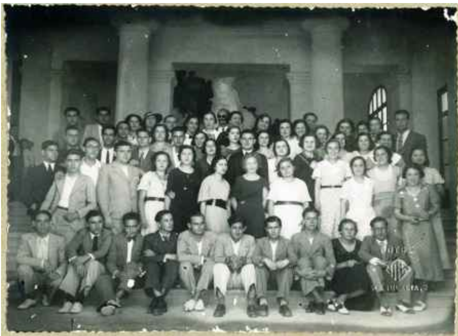
Grup de professors i alumnes dels anys 30

El 17 d'octubre de 1842 s'inaugurava l'Escola Normal de les Balears a l'oratori de Montision.