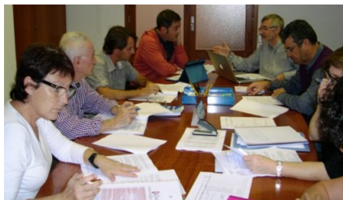
Comissió Específica d'Ordenació i Innovació del Sistema Educatiu duta a terme dia 03-11-15 (seu del CEIB)