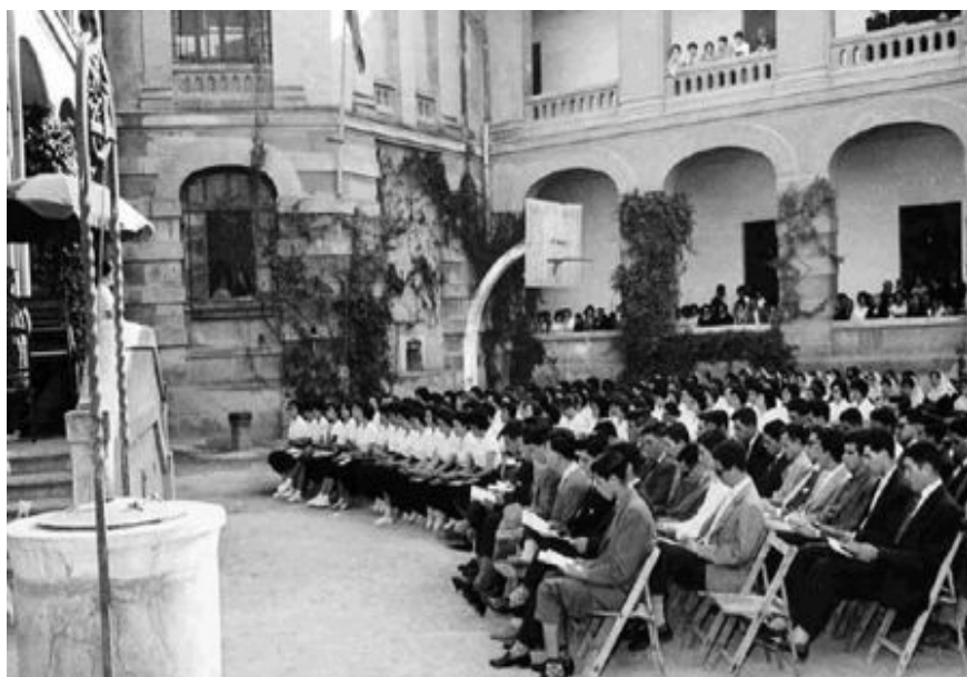
Acte acadèmic, pati de l'Escola Normal

No és fins a partir del 1834 que es comença a posar fil a l'agulla. En fou el principal promotor Gil de Zárate, que, juntament amb Pablo Montesino (que va dur la idea de França), va muntar la primera escola normal a Madrid, l'any 1835. Per això, el ministre Moscoso de Altamira va constituir una comissió amb la finalitat d'elaborar un pla general d'instrucció i "la creación de una Normal, en la que se instruyan los profesores de provincias que deben generalizar en ellas tan benéfico método (lancartesiano)". La primera escola normal o Seminario Central de Maestros del Reino es va inaugurar el 8 de març de 1839 i en fou el primer director Pablo Montesino.