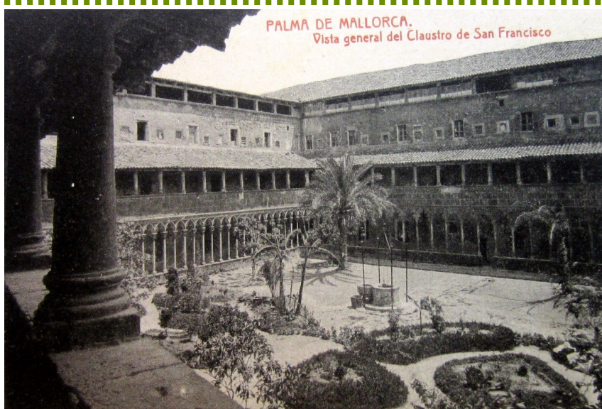
Vista del claustre del convent de Sant Francesc, primera seu de l'Escola Normal

La idea de convertir les acadèmies de primera educació en escoles normals ve d'Europa, on tenen una implantació vinculada a la Revolució Francesa i a l'expansió ideològica d'aquesta per Europa.