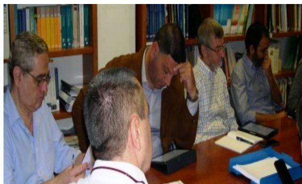
Comissió Permanent duta a terme dia 12-11-15

Un altre aspecte molt rellevant d'aquest curs fou que l'Estat va aprovar i aplicar la LOMCE, amb repercussions directes sobre les competències dels consells escolars de centre i l'inici de les avaluacions de diagnòstic. A les nostres illes, a més d'això, s'hi ha d'afegir tot el que va suposar la imposició del TIL (Tractament Integrat de Llengües): un programa implementat sense tenir en compte l'autonomia dels centres, ni les característiques d'aquests, ni la formació del professorat que havia d'impartir aquestes àrees; en definitiva, una normativa que no estava basada en la realitat dels nostres centres i que es va aplicar sense el consens dels òrgans corresponents.