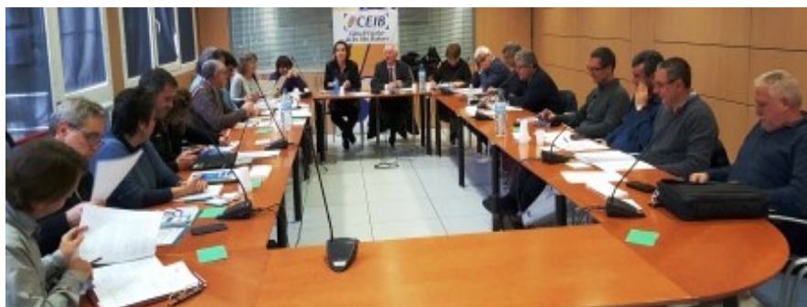
Consellers i conselleres del CEIB a la sala d'actes de la FELIB