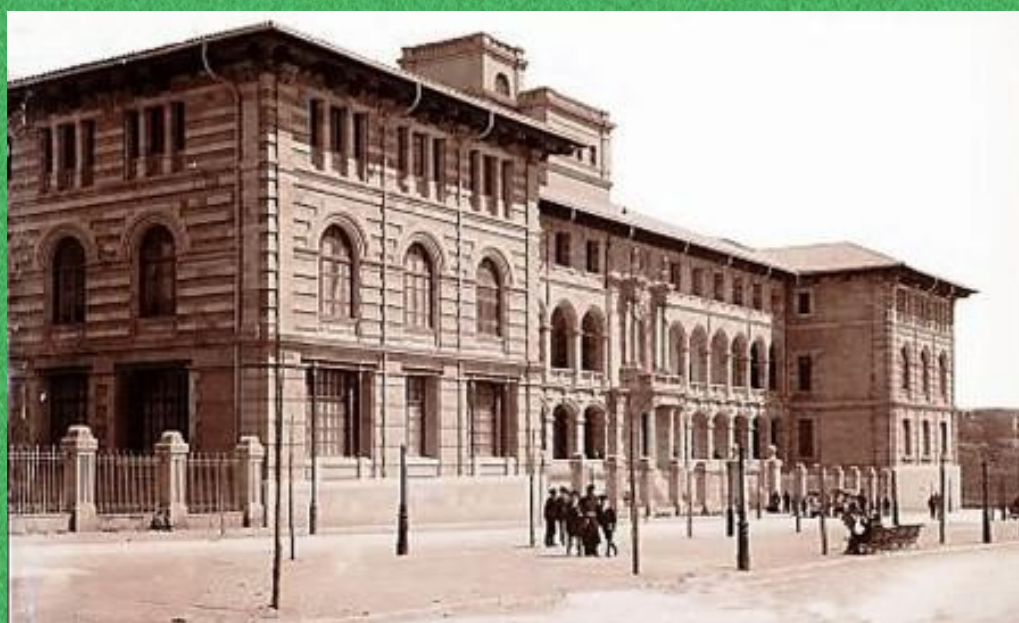
Institut Ramon Llull de Palma