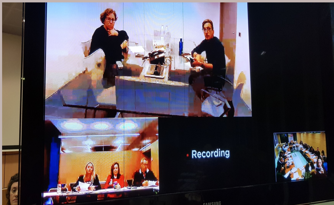
Reunió del Ple 22/11/2019 a la sala de reunions de la FELIB., en connexió per videoconferència amb el Consell Insular de Menorca i el Palau de