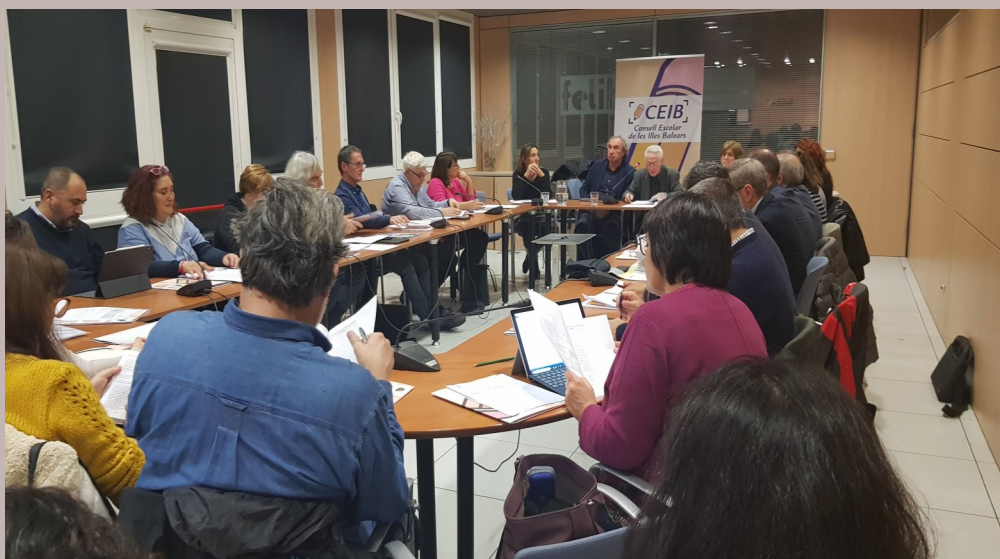
Reunió del Ple 22/11/2019 a la sala de reunions de la FELIB

Seguidament va lliurar les credencials als nous consellers per formalitzar la presa de possessió del càrrec.