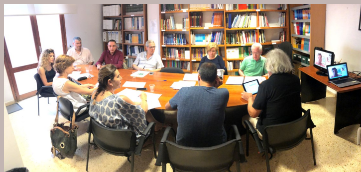
Reunió de la CP 01/06/2019 a la sala de reunions del CEIB