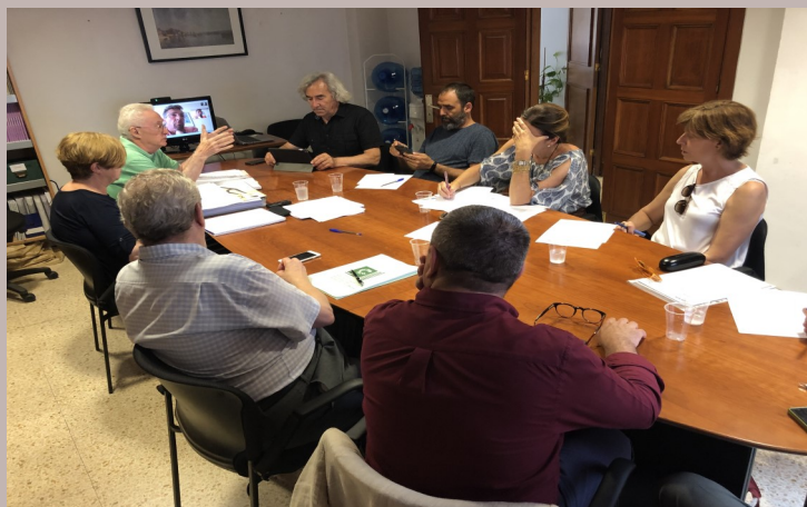
Reunió de la CP 01/06/2019 a la sala de reunions del CEIB