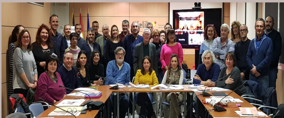
Reunió del Ple 22/11/2019 a la sala de reunions de la FELIB., en connexió per videoconferència amb el Consell Insular de Menorca i el Palau de Congressos d'Eivissa (Sta. Eulàlia des Riu)

Finalment s'obrí un torn de paraules i els consellers i conselleres pogueren intervenir.