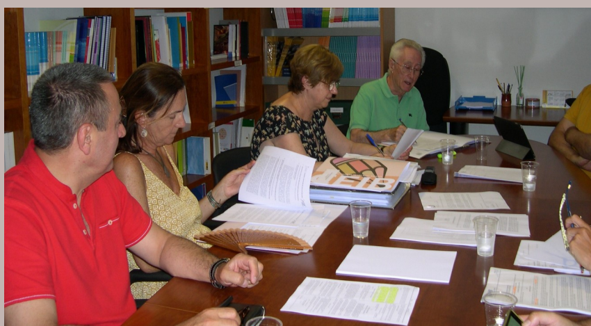
Reunió de la CP 01/06/2019 a la sala de reunions del CEIB