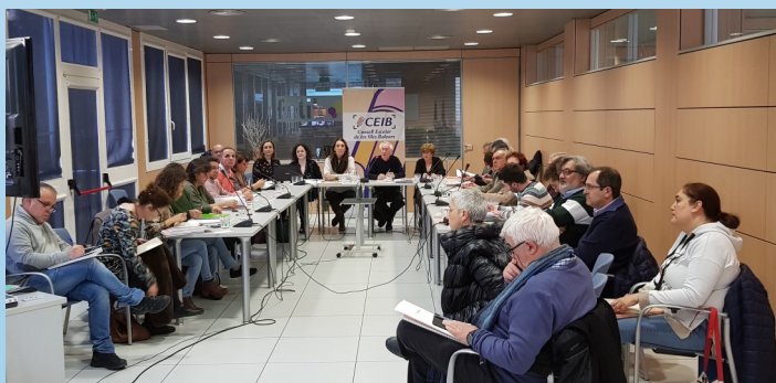
Consellers i conselleres del CEIB durant el Ple.

Per altra banda, posà de manifest la preocupació generada, dins l'àmbit social i sobretot dins la comunitat educativa de les Illes Balears, per les visites planificades de parlamentaris de VOX als centres educatius. Considerà adient que el CEIB fes un manifest de suport al professorat i als centres davant aquesta intromissió i afegí que es podien remetre propostes de redactat al CEIB.