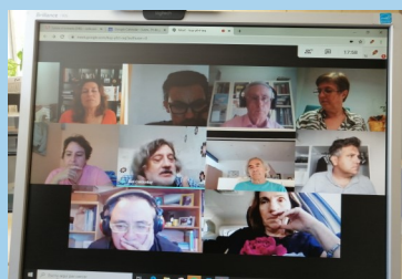
Membres de la Comissió Permanent