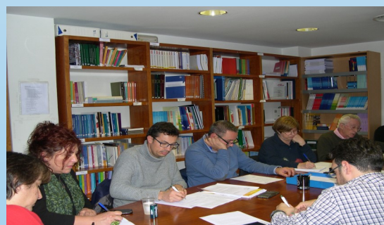
Membres de la Comissió Permanent