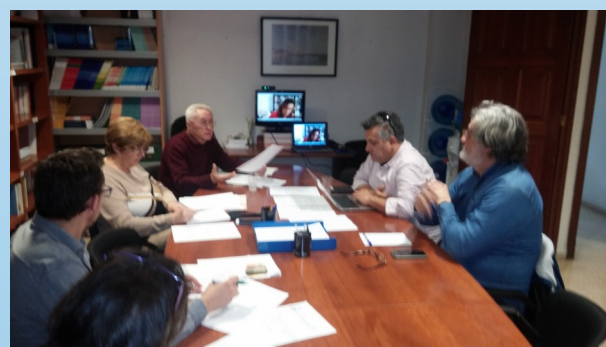
Membres de la Comissió Permanent