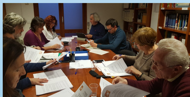
Membres de la Comissió Permanent