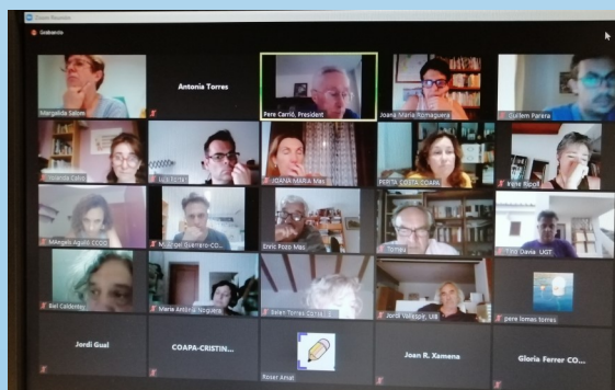
Consellers i conselleres del CEIB durant el Ple.

S'acordà retirar la proposta de donar el nom d'Andreu Crespí a un institut d'educació secundària. i dur-la al proper Ple.