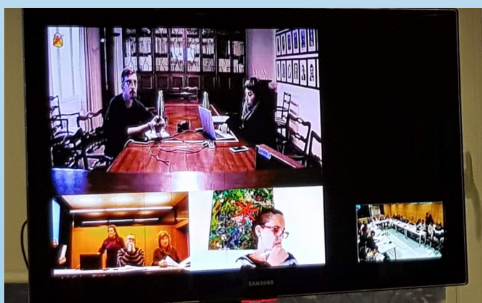
Consellers i conselleres del CEIB durant el Ple.