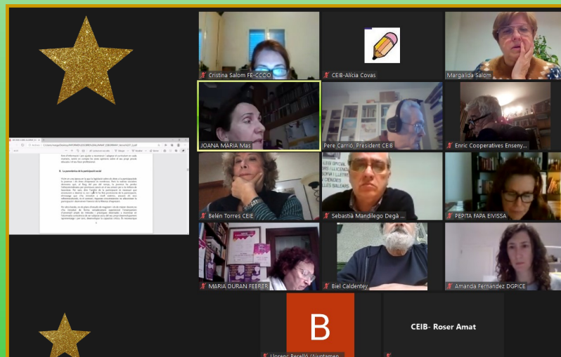
CETPA 17/12/2020 CEIB