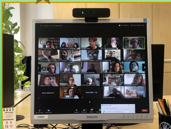
CETPA 28/10/2020 CEIB