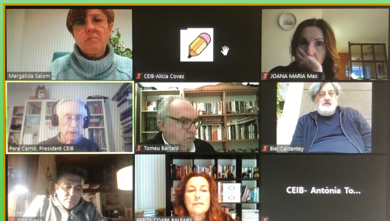
Comissió Permanent 02/12/2020 CEIB