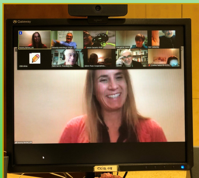
Comissió Específica d'Ordenació i Innovació del Sistema Educatiu 20/11/2020 CEIB